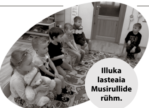
Illuka lasteaia Musirullide rühm.