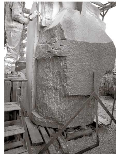
Kivi töötlemine kiviraiumise töökojas Laagris, Tallinnas.