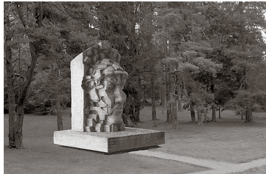
Mälestusmärgi kavand. Vaade läänest, Iisaku-Tudulinna maantee pealt.