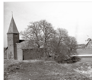
Tudulinna vana puukirik ja veski 1937. aastal.

Seisib ja lagunes, kuni 2017. aasta augustis tuli kokku grupp ärksaid, kultuurihuviga inimesi ja asutati MTÜ Tudulinna Kultuurikants eesmärgiga taastada ajalooline Tudulinna vana kirik. Taastada üle 250 aasta vanune arhitektuurimälestis, aga anda talle uus, eluline funktsioon – kultuurikeskus. On ju Tudulinna läbi aegade olnud elav