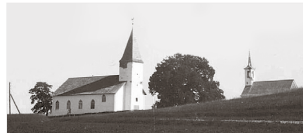
Tudulinna vana ja uus kirik pärast II Maailmasõda.

kultuurielu – lavastati näidendeid ja operette, tegutsesid puhkpilliorkester ja laulukoorid. Taastatud vanasse kirikusse saab kutsuda esinema kõiki tippartistide, kuna puuhoone akustika on väga hea. Kogukonna liikmed aga saavad seal tegutseda regulaarselt, korraldada mitmeladseid sündmusi, kontserte, kokkulekuid, mõttetubasid ja muud vajalikku.