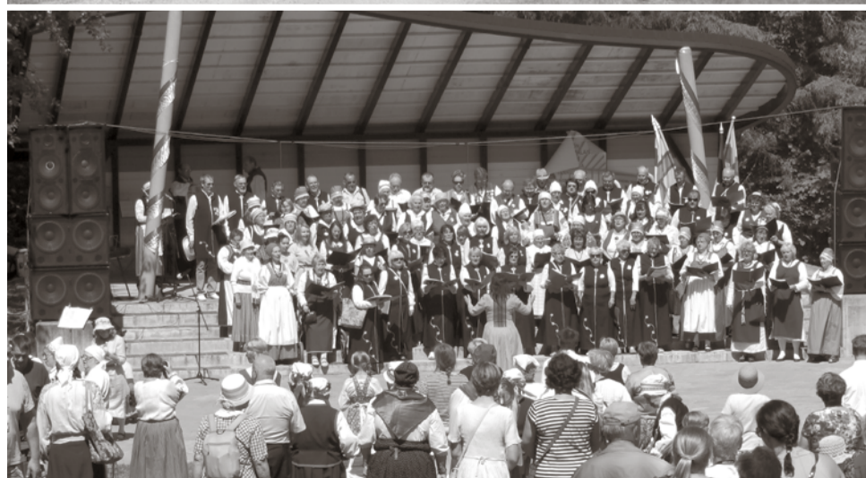
16. juunil toimus Iisakus Eesti ingerisoomlaste XXVIII laulu- ja tantsupidu. Peale jumalateenistust Iisaku kirikus liiguti rongkäigus rahvamaja juurde laululavale, kus laulu- ja tantsurühmad Eestist, Soomest ja Venemaalt jagasid üksteisega esinemisrõõmu ning pakkusid toreda kontserdielamuse publikule.