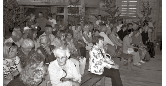
Pilgeni inimesi täis kirik kontserdil.