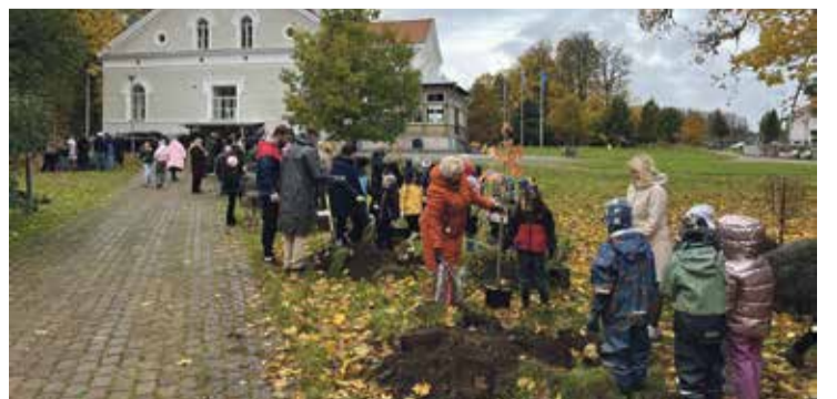
Illuka kooli- ja lasteaiapere kirsipuid istutamas.

Eluring ja väärtuste mõtestamine. Õppimine ei lõpe kunagi, vaid muutub ja areneb nagu aastaring ise.