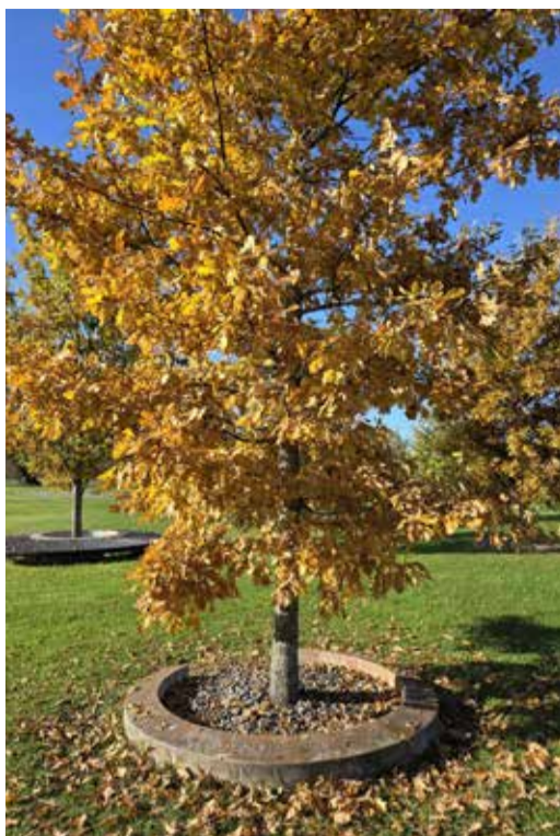
EV 100 puhul rajatud Tamsalu 100 tamme park on eriti kaunis sügisel ja ilusa ilmaga.