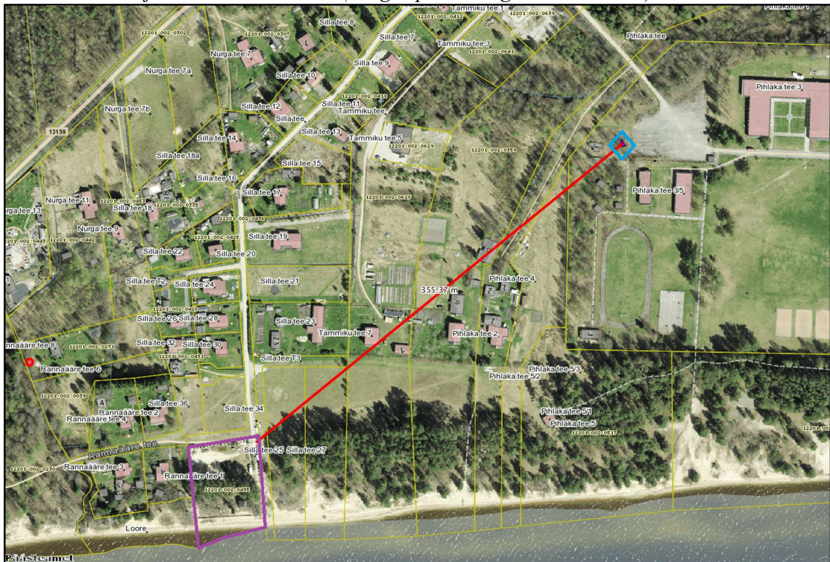
Joonis 2 Tuletõrje veevõtukohta skeem (kaugus planeeringualast ca 355m)

Tuletõrjehüdrandid Alajõe piirkonnas puuduvad. Lähim tuletõrje veevõtukoht on planeeringualast linnulennult ca 355 m kaugusel, Remniku lastelaagri territooriumil (Pihlaka tee 3) asuv veemahuti (X=6546725.59, Y=702316.16).