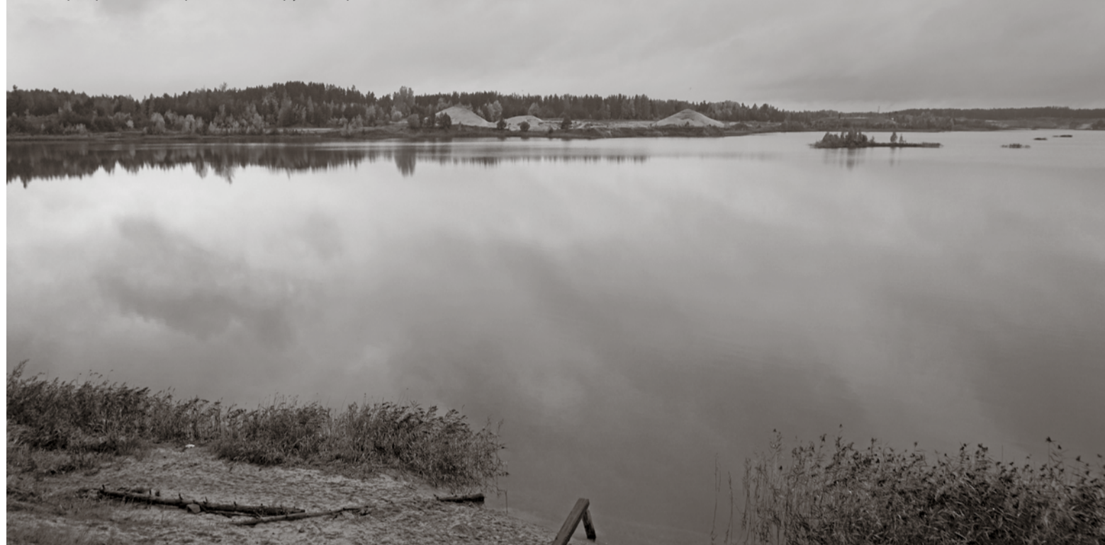
Рядом с прекрасными Куртнаскими озерами в ходе добычи песка на карьере "Панныярве" возник рукотворный водоем