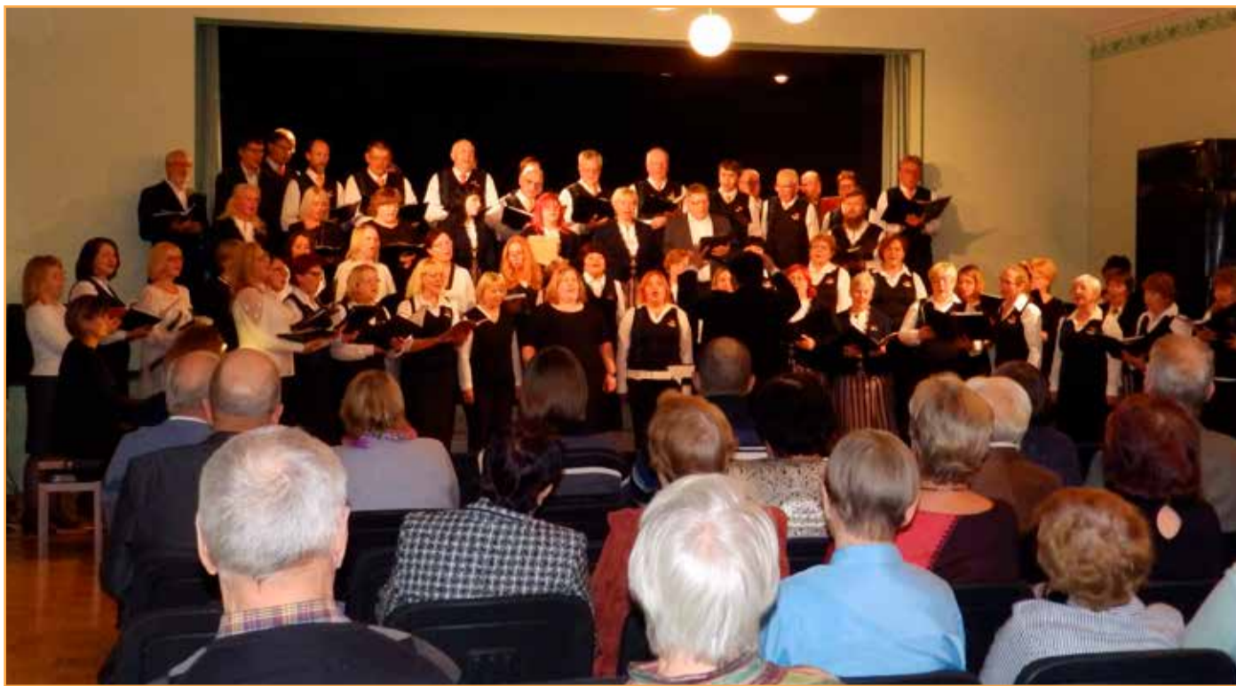
Reedel, 18. oktoobril, kutsus lisaku segakoor suure suvise peo tuules lisaku rahvamajja Atsalama, Oonurme ja Kirderanniku koorilauljad, et pühendada üks kaunis kontsert Robert Theodor Hansenile tema 170. sünniaastapäeval. Hansen on meie kultuurilukku jäädvustunud laulu "Ema süda" autorina.