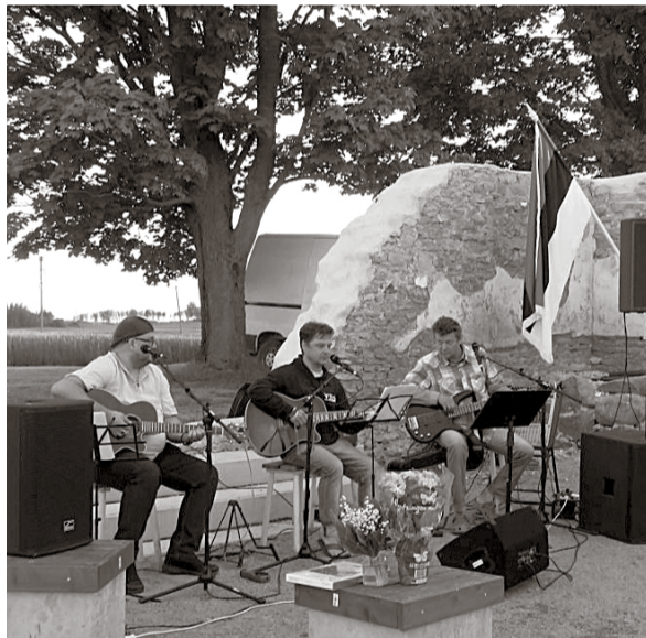
Atsalama küla naabruses Rajamäe talus teeb bändiproove ansambel AER, kes lipupäeva õhtut autorilauludega rikastas.

Tänaseks on Atsalama aktiivsem seltskond juba ka esimese mõttevahetuse maha pidanud ning selle tulemusena annab teada, et 22. juuni õhtul kell 20 süüdatakse ühiselt jaanilõke ning 22. augustil 10–14 on kõik oodatud (nii lähemalt kui kaugemalt) teeäärsele külaladaale.