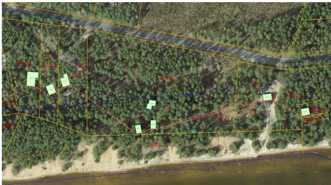
Skeem 1. Alutaguse Vallavalitsuse poolt 21.02.2024 koostatud ehitusjoone analüüs. Helerohelisega on märgitud ehitisregistris olevad õiguspäraselt rajatud hooned. Ehitusjoon on märgitud punaka katkendjoonega.

Looduskaitseaduse § 38 lg 2 kohaselt ulatub ehituskeeluvöönd metsamaal metsaseaduse § 3 lõike 2 tähenduses ranna piiranguvööndi piirini. Antud säte detailplaneeringu alal ei kohaldu lähtuvalt detailplaneeringu alal asuva metsamaa paikenemisest (vt joonis nr 2).