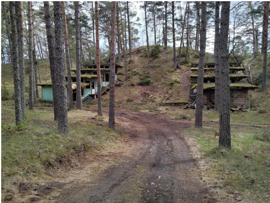
Foto 1. Vaade lõuna poole (Peipsi järve poole) luidete vahel paiknevatele endistele suvilatele nr 1 ja 3.

Kassikaku maaüksus on varasemalt olnud hoonestatud nelja suvilaga, mis on kasutusest väljas ja amortiseerunud (vt foto 1). Endistest suvilatest on alles kolm (suvilad 1-3, vared); neljas (suvila 4), mis asus maaüksuse keskosas, ei ole säilinud (eeldatavast asukohast annab märku väikesemahuline vare). Olemasolev vare, mis asub maaüksuse kagunurgas, ehitisregistris ei kajastu.